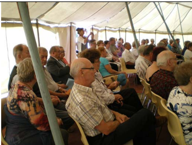
Suurteltan juhlayleisöä.